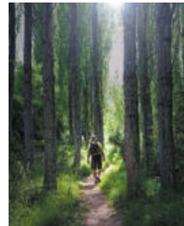
Sendero del barranco del río Boilgues.

lle: es la hoz del Bohígues, donde el río que acaba de verse manso y servicial, lamiendo los muros de fábricas y molinos, brinca y beorea como un salvaje, encajonado entre cantiles tapizados de hiedra, rubia, zarzamora, nueza y madreSelva. A partir de aquí hay que andar atentos para descubrir, a través de la espesura, una cascada de cuatro metros de altura que cae a plomo sobre una poza de 15 de diámetro, con aguas de un color verde inaudito, que parecen tratadas con Photoshop. El hallazgo acontece al cumplirse, poco más o menos, 50 minutos