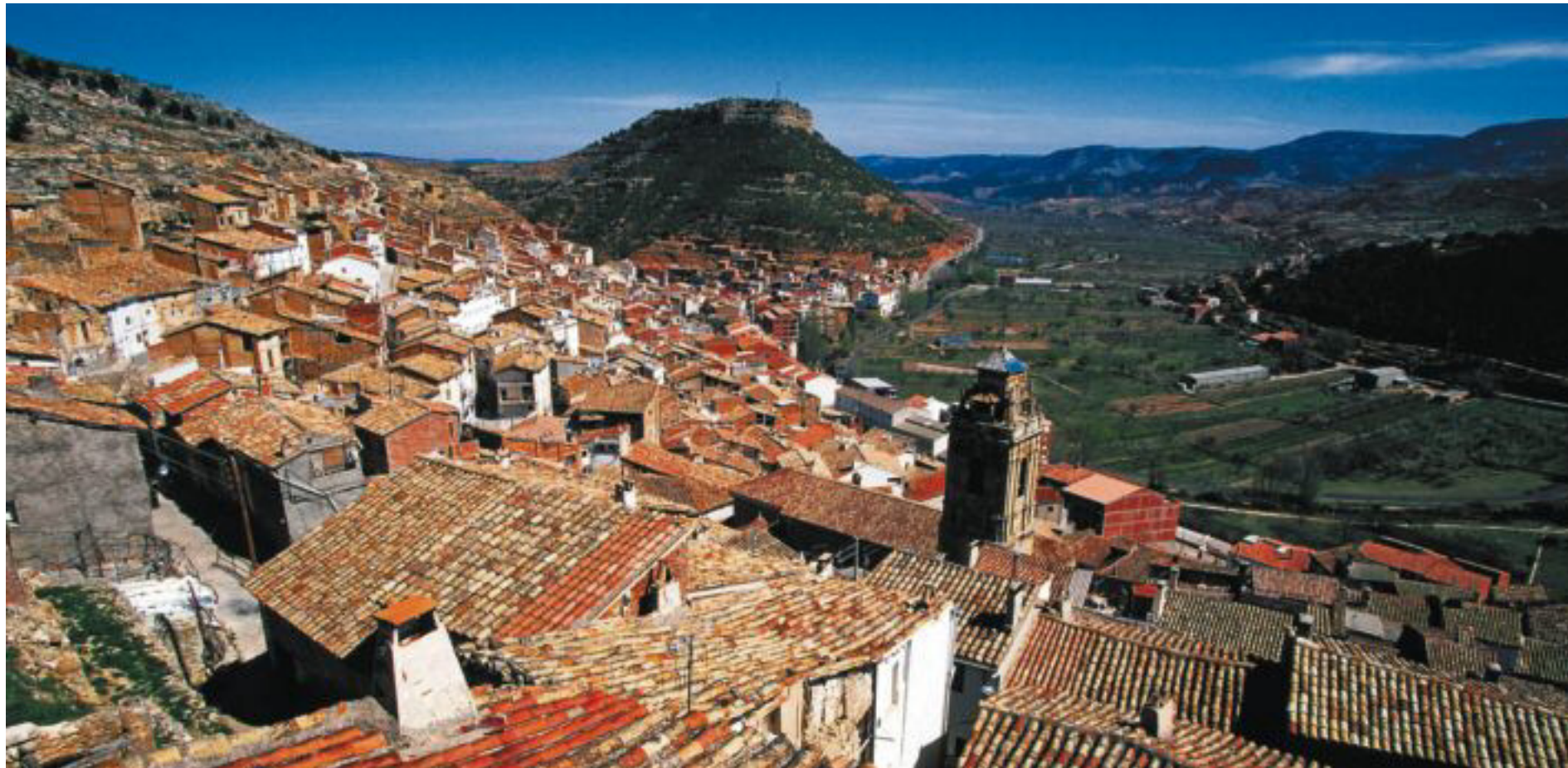
Panorámica de Ademuz desde la parte alta del pueblo valenciano.